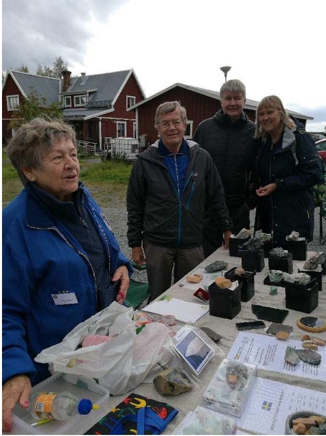
så mye for Thulitten de fikk fra TAGF.