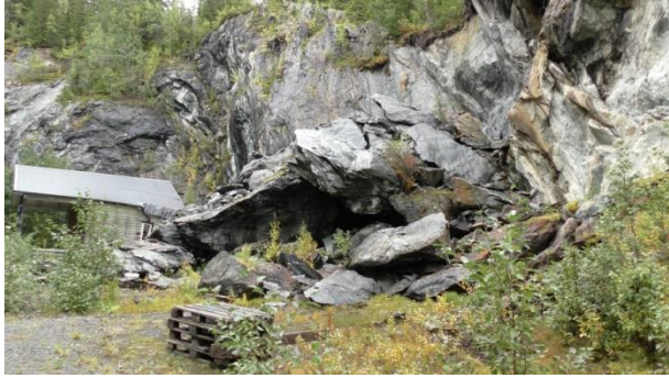
Utrasing fra steil sidevegg.