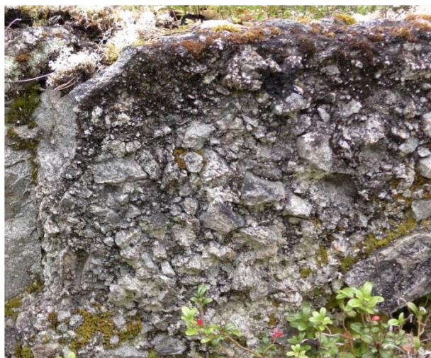
«Tandsby-breksje» med skarpkantede fragmenter fra det knuste, granittiske grunnfjellet.

Meteoritten knuste det granittiske grunnfjellet. De skarpkantede fragmentene ble kittet sammen til en breksje (bruddstykke-bergart) som kalles «Tandsby-breksje». De enorme vannmassene som strømmet tilbake til krateret førte med seg store mengder sand og grus som dekket det aller meste av breksjen (bortsett fra deler på kraterkanten). Denne sandavsetningen kalles «Lofstar-sten». Over denne finnes en marin avsetning av kalkstein, «Dalby-kalksten». I denne finnes mye skall og fragmenter av særlig ordovisiske fossiler: brakiopode (armfoting, ligner musling), ostracode (muslingkreps), cystoideer (pigghud, liljedyr), trilobitter (et leddyr) og ortoceras (en blekksprutart).