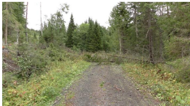
Det lå trær over veien til bruddet.