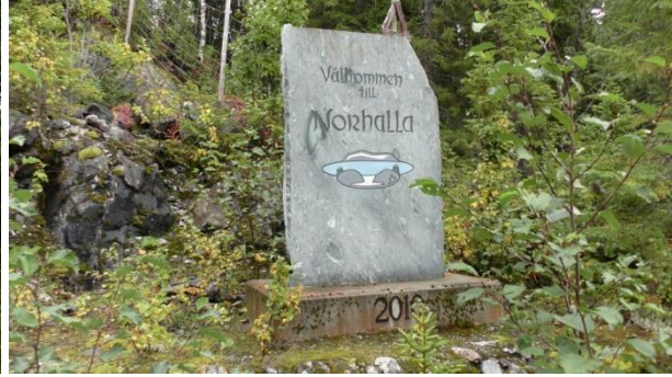
Steinplate ved inngangen til dagbruddet.

I bruddet er det satt opp hus med scene og benker utenfor. Området har vært benyttet til «evenementer» tidligere, men deler av huset er knust etter at fjellet bak har rast ut. Sidene er rasfarlige, så unger og hunder bør holdes i bånd.