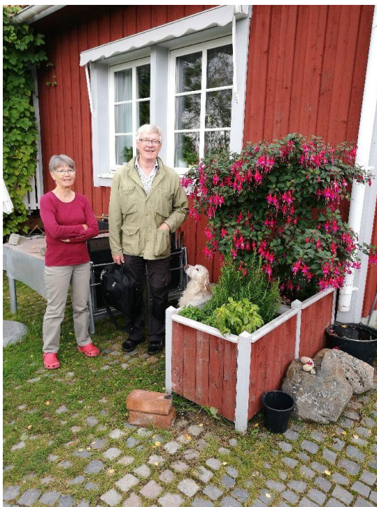
deres hage i Oviken.