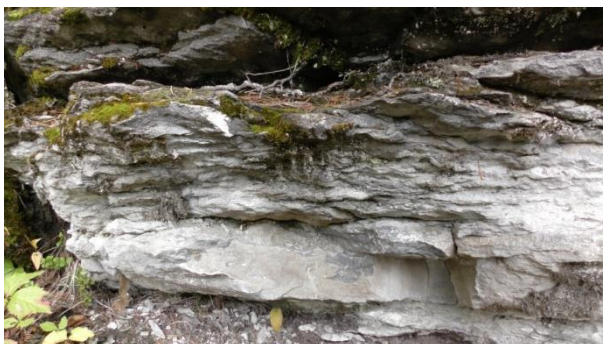
«Dalby-kalksten» ble avsatt etter dannelsen av meteoritt-krateret.