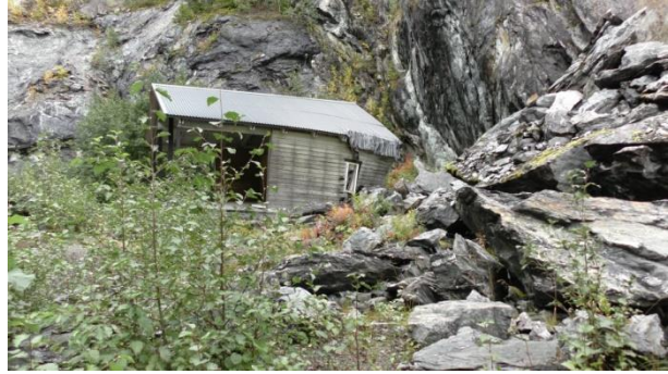
Scenebygget var sterkt skadet.