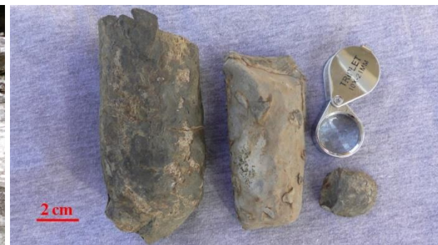
To biter av ordovisisk ortoceras blekksprut og en liten brakiopode som ble funnet ved stien.