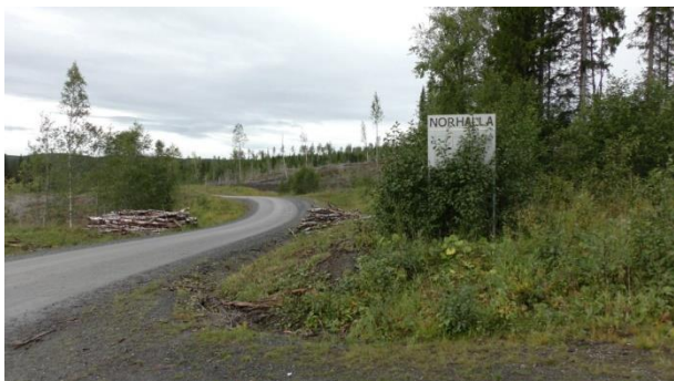
Skilt som viser «Norhalla».

Når du kommer fra Norge, ta av fra E14 til venstre etter bro i Staa, 3 km før Duved. Kjør gjennom stedet Nordhallen til et skilt hvor det står «Norhalla». Herfra går det en dårlig vei opp til bruddet; det tar 10 minutter å gå. Veien opp var ikke kjørbær denne høsten. Det lå flere trær over veien, men det var god plass til biler der den startet.