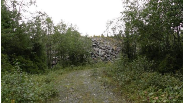
Steinfylling nedenfor bruddet.