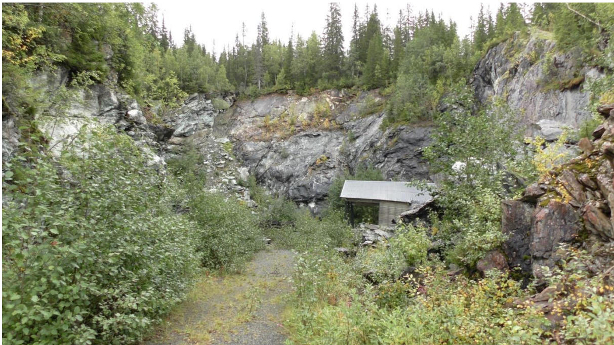
Det forlatte steinbruddet er noe tilgrodd.

Vi undersøkte ikke hele bruddet denne gangen. Tenkte vi ville få muligheten til det ved en senere anledning.